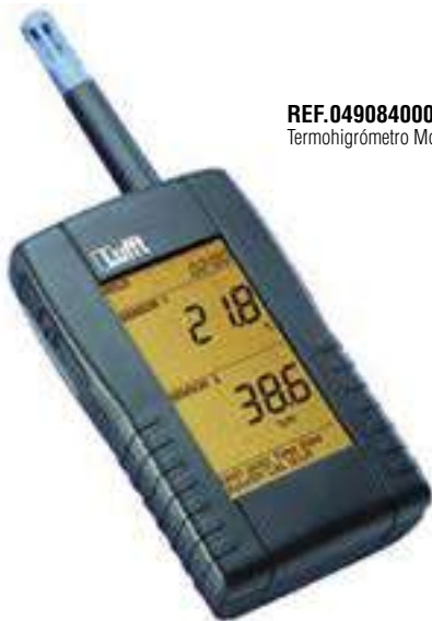
REF.0490840007 | Termohigrómetro Modelo E-200 5220 .00