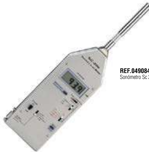
REF.0490840002 | Sonómetro Sc 20c