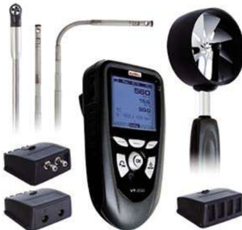
REF.0490840031 | Anemómetro Térmico Modelo Vt 50