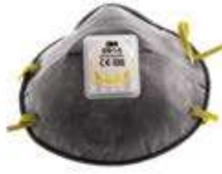
REF.1000101914 | Normativa: EN149 Mascarilla Autofiltrante Vapores Orgánicos FFP1 con VALV. 9914 3M Unidad de Servicio: 10 Uds. por Caja: 100