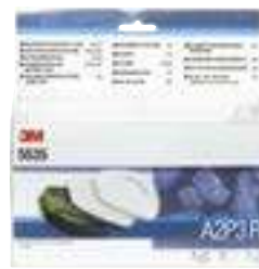
REF.1000105535 | Pack Recambio Filtros 5535 A2P3R Unidad de Servicio: 1 Uds. por Caja: 4