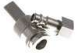
REF.1055301282 | Juego de Conexión Rápida-RECTUS 25, Rosca Hembra 3/8" BSP Unidad de Servicio: 1 Uds. por Caja: 3