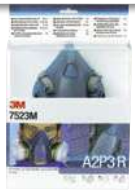
REF.1000107523 | Pack Mascarilla Con Filtros 7523M (7502 A2P3) Unidad de Servicio: 1 Uds. por Caja: 4