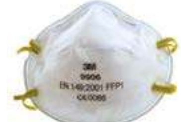
REF.1000101706 | Normativa: EN149 Mascarilla Autofiltrante Fluorídrico FFP1 9906 3M Unidad de Servicio: 20 Uds. por Caja: 100