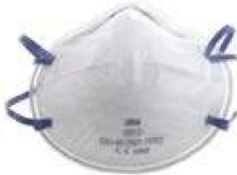
REF.1000101810 | Normativa: EN149 Mascarilla Autofiltrante FFP2 8810 3M Unidad de Servicio: 20 Uds. por Caja: 240