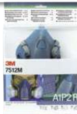
REF.1000107512 | Pack Mascarilla con Filtros 7512M (7502 A1P2) Unidad de Servicio: 1 Uds. por Caja: 4