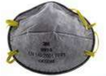
REF.1000101913 | Normativa: EN149 Mascarilla Autofiltrante Vapores Orgánicos FFP1 9913 3M Unidad de Servicio: 20 Uds. por Caja: 100