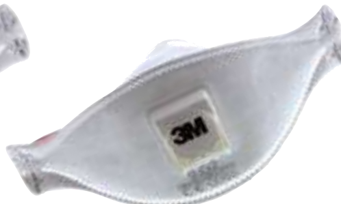
REF.1000101332 | Normativa: EN149 Mascarilla Autofiltrante Plegada FFP3 con VALV. 9332 3M Unidad de Servicio: 10 Uds. por Caja: 120