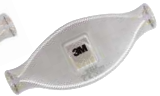
REF.1000101312 | Normativa: EN149 Mascarilla Autofiltrante Plegada FFP1 con VALV. 9312 3M Unidad de Servicio: 10 Uds. por Caja: 120