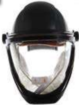
REF.1050450012 Casco de Seguridad Verde HT-840