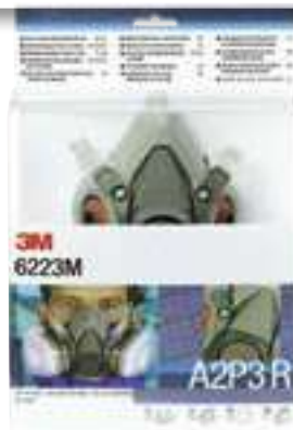
REF.1000106223 | Pack Mascarilla con Filtros 6223M (6200 A2P3) Unidad de Servicio: 1 Uds. por Caja: 4