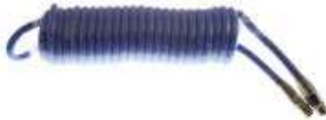
REF.1053080030 | Normativa: EN 12941 Manguera Estandar de 10 Metros Unidad de Servicio: 1 Uds. por Caja: 1