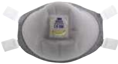
REF.1000101925 | Normativa: EN149 Mascarilla Autofiltrante FFP2 con VALV. OZ 9928 3M Unidad de Servicio: 10 Uds. por Caja: 80