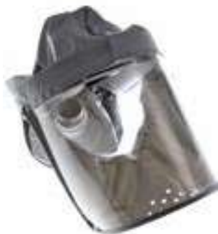
REF.1050450060 Capucha Gris HT-103