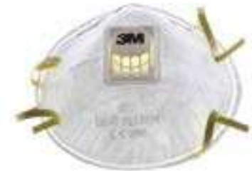
REF.1000101812 | Normativa: EN149 Mascarilla Autofiltrante FFP1 con VALV. 8812 3M Unidad de Servicio: 10 Uds. por Caja: 240