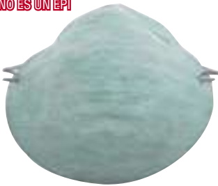
REF.1000101750 | Mascarilla Autofiltrante 600 HIGIENE Unidad de Servicio: 50 Uds. por Caja: 600