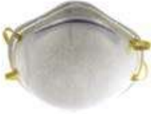
REF.1000059201 | Normativa: EN149 Caja 20 Unds Mascarillas Particulas FFP1 Unidad de Servicio: 1 Uds. por Caja: 20