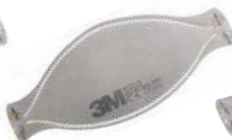
REF.1000101310 | Normativa: EN149 Mascarilla Autofiltrante Plegada FFP1 9310 3M Unidad de Servicio: 20 Uds. por Caja: 240