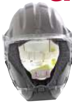
REF.1050610082 Unidad de Cabeza HT-701