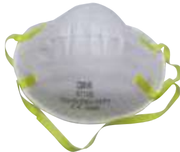
REF.1000101710 | Normativa: EN149 Mascarilla Autofiltrante FFP1 8710 3M Unidad de Servicio: 20 Uds. por Caja: 240