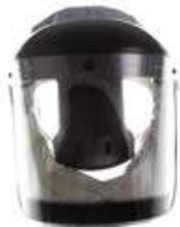
REF.1050490056 Unidad de Cabeza HT-402 con Visor de Policarbonato