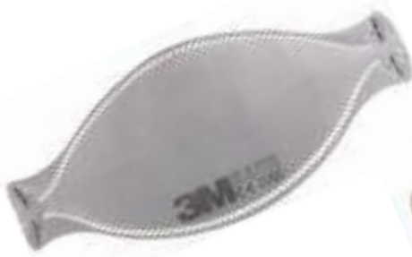
REF.1000101320 | Normativa: EN149 Mascarilla Autofiltrante Plegada FFP2 9320 3M Unidad de Servicio: 20 Uds. por Caja: 240