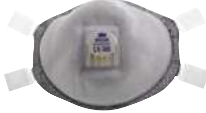
REF.1000101928 | Normativa: EN149 Mascarilla Autofiltrante FFP2 con VALV. OZ 9928 3M Unidad de Servicio: 10 Uds. por Caja: 80