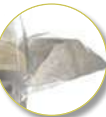
REF.1050450061 Capucha Blanca Recubierta Poliprop. HT-120