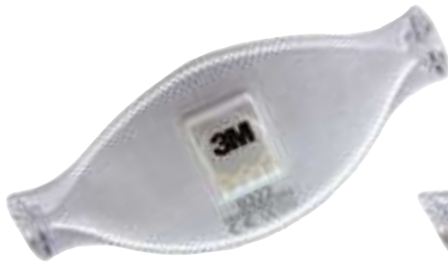
REF.1000101322 | Normativa: EN149 Mascarilla Autofiltrante Plegada FFP2 con VALV. 9322 3M Unidad de Servicio: 10 Uds. por Caja: 120