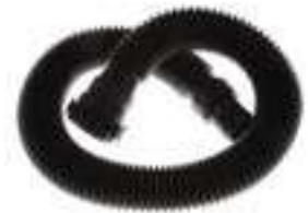
REF.1050080042 Tubo Conductor Aire Ligero QRS BAY