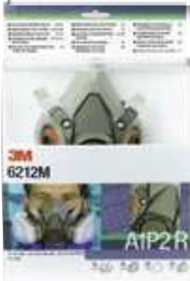
REF.1000106212 | Pack Mascarilla con Filtros 6212M (6200 A1P2) Unidad de Servicio: 1 Uds. por Caja: 4

LISTOS PARA USAR; GRAN VARIEDAD DE SECTORES: INDUSTRIAS, CONSTRUCCIÓN, AGRICULTURA, PINTURA, ETC. DOS TAMAÑOS.