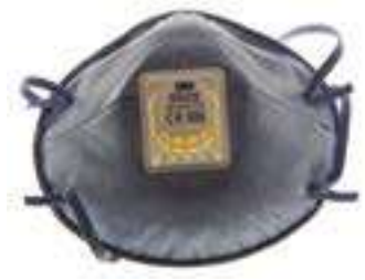
REF.1000101926 | Normativa: EN149 Mascarilla Autofiltrantes Gases Ácidos FFP2 con VALV. 9926 3M Unidad de Servicio: 10 Uds. por Caja: 100

LISTOS PARA USAR; GRAN VARIEDAD DE SECTORES: INDUSTRIAS, CONSTRUCCIÓN, AGRICULTURA, PINTURA, ETC. DOS TAMAÑOS.