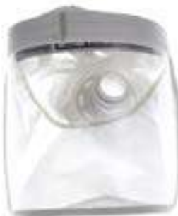
REF.1050450059 Capucha Blanca HT-101