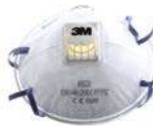
REF.1000101822 | Normativa: EN149 Mascarilla Autofiltrante FFP2 con VALV. 8822 3M Unidad de Servicio: 10 Uds. por Caja: 240