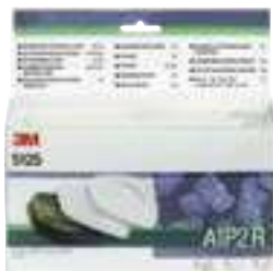
REF.1000105125 | Pack Recambio Filtros 5125 A1P2R Unidad de Servicio: 1 Uds. por Caja: 4