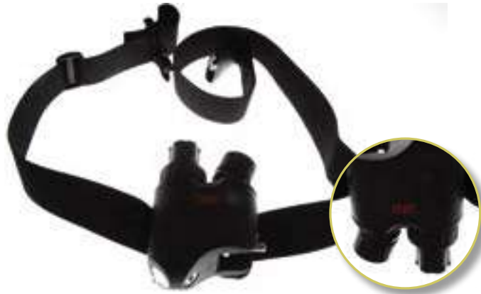
REF.1050230550 | Regulador FLOWSTREAM con Cinturón Unidad de Servicio: 1 Uds. por Caja: 1