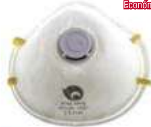
REF.1000059202 | Normativa: EN149 Caja 12 Unds Mascarillas Particulas FFP2 con Válvula Unidad de Servicio: 1 Uds. por Caja: 20