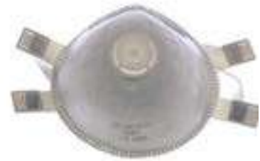
REF.1000059203 | Normativa: EN149 Caja 5 Unds Mascarillas Particulas FFP3 con Válvula Unidad de Servicio: 1 Uds. por Caja: 12