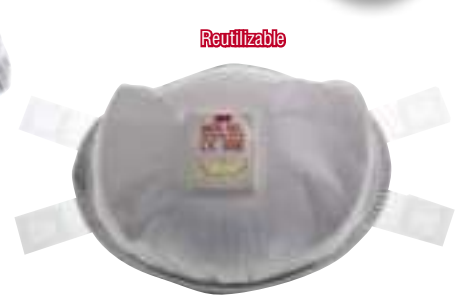
REF.1000101835 | Normativa: EN149 Mascarilla Autofiltrante FFP3 con VALV. 8835 3M Amianto Unidad de Servicio: 5 Uds. por Caja: 50