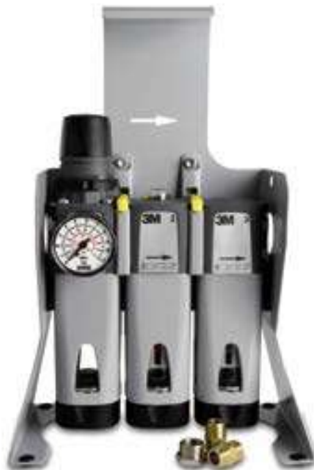
REF.1053000623 | Unidad de Filtración de Aire Comprimido a Pared Unidad de Servicio: 1 Uds. por Caja: 1