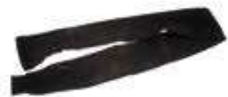
REF.1050080800 Cubierta Protectora para Tubo Respiración