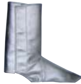
REF. 1608020001 | TALLAS: Única P. Polaina Aluminizada Ka-1 36 cm con Velcro