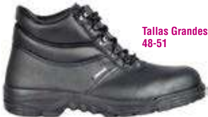
Tallas Grandes 48-51

REF. 16000016 | TALLAS: 40-47 Bota Conductor SECUREX Nitrilo SB EPC WRU HRO FO SRC Unidad de Servicio: 1 Uds. por Caja: 10