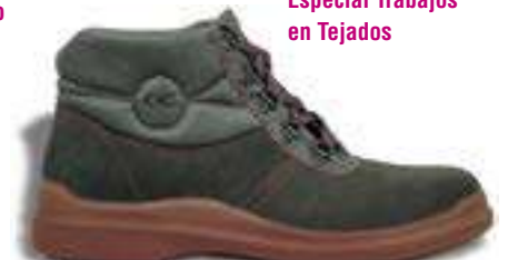
Especial Trabajos en Tejados

REF. 16014370 | TALLAS: 39-47 Bota Piel Serraje Hidrofugada DACHDECKER PU/Nitrilo O3