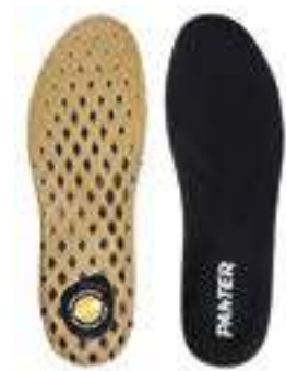
REF. 16014347 | TALLAS: 36-48 Plantillas Tri-Tec Máxima Transpiración