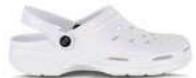
REF. 16155601 | TALLAS: 36-45 Zueco Blanco Ultraligero Eva P2008