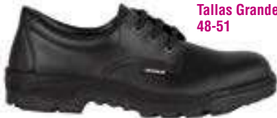
Tallas Grandes 48-51

REF. 16014355 | TALLAS: 37-48 Bota Piel Flor Hidrofugada METALEO 248 PU/Nitrilo S3 M HRO