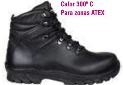
Bota Conductor Marcado C Calor 300° C Para zonas ATEX

REF. 16000016 | TALLAS: 40-47 Bota Conductor SECUREX Nitrilo SB EPC WRU HRO FO SRC Unidad de Servicio: 1 Uds. por Caja: 10