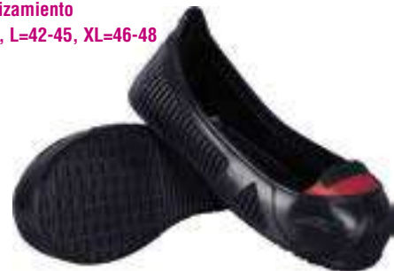
REF. 16020202 | TALLAS: S-M-L-XL Cubrecazado Antodeslizante con Puntera Protección