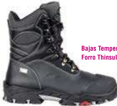
Bajas Temperaturas Forro Thinsulate

REF. 16014372 | TALLAS: 36-48 Bota Piel Flor COMBATE Sympatex Nitrilo O2