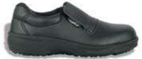
REF. 16014383 | TALLAS: 35-48 Zapato Microfibra Hidrofugado ITACA PU S2