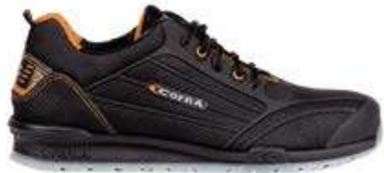
REF. 16000114 | TALLAS: 36-48 Zapato Piel Hidrofugado CREGAN PU/TPU S3 SRC