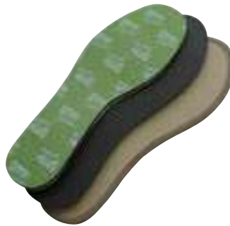
REF. 16014605 | TALLAS: 38-47 P. Plantillas Espuma Antibacterias