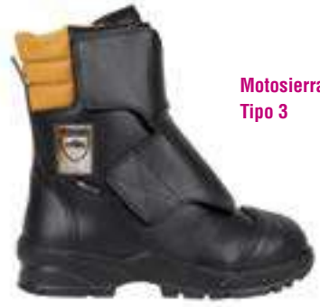
Motosierras Tipo 3

REF. 16014371 | TALLAS: 36-48 Bota Piel Flor RIDER Sympatex Nitrilo O2