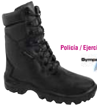
Policia / Ejercito

REF. 16014369 | TALLAS: 39-48 Bota Motosierrista Strong Suela Nitrilo Cosido A E P FO WRU HRO SRC