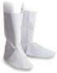
REF. 1601630300 | TALLAS: Única P. Polaina en Serraje cierre Velcro 300 Pm