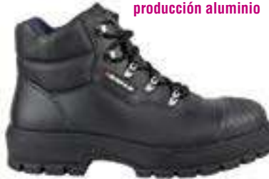
Protección interior Anticorte Vidrieras, automoción, producción aluminio

REF. 16014373 | TALLAS: 39-47 Bota Piel Flor SHEFFIELD PU/Nitrilo S3 HRO CR SRC Unidad de Servicio: 1 Uds. por Caja: 10