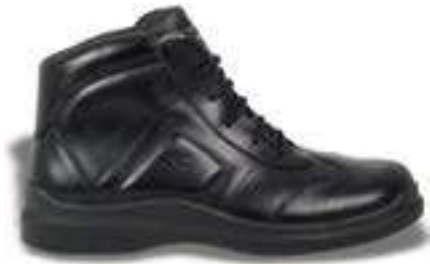
REF. 16001469 | TALLAS: 39-47 Bota Piel Flor Hidrofugada ZONDA PU/Nitrilo O2