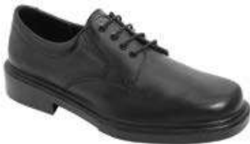
REF. 16014375 | TALLAS: 36-48 Zapato Piel Flor Cordones Mod. 81500 PU