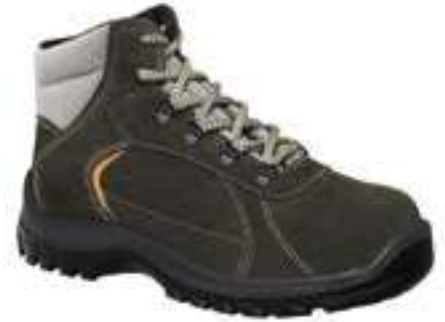
REF. 16014346 | TALLAS: 37-48 Bota Serraje SUPER BREGA PU S1P