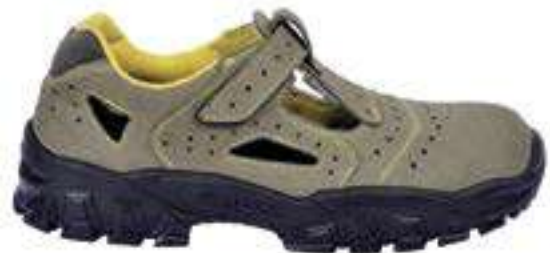
REF. 16014051 | TALLAS: 36-48 Sandalia Piel Engamuzada BRENTA PU S1P