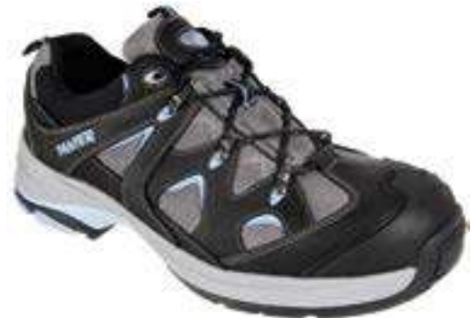
REF. 16014423 | TALLAS: 38-48 Zapato Piel Flor SENDA Eva/Nitrilo S1P