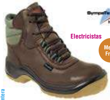
REF. 16014425 | TALLAS: 35-48 Bota Piel Flor ALPINA Azul Oxígeno Sympatex PU/TPU S3