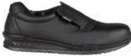
REF. 16000014 | TALLAS: 36-47 Zapato Fibra Newtech PUBLIUS PU/TPU S2 SRC