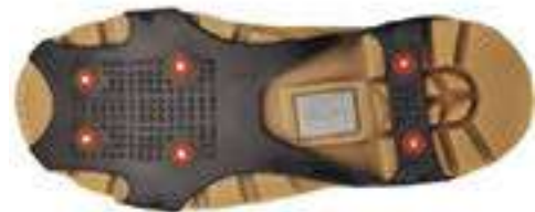
REF. 16093801 | TALLAS: L y XL P. Suelas de Agarre con Clavos