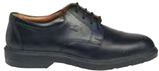
REF. 16001491 | TALLAS: 39-47 Zapato Piel Flor C/Cordon COULOMB PU S2