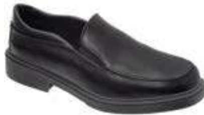
REF. 16014384 | TALLAS: 36-48 Zapato Mocasín Piel Flor Mod. 81600 PU