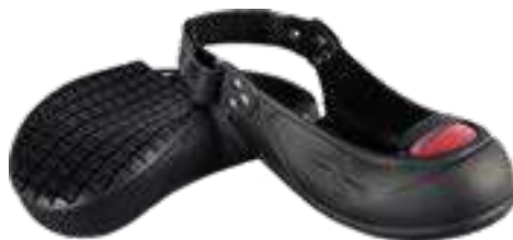
REF. 16020201 | TALLAS: S-M-XL Puntera de Visita. VISISTOR