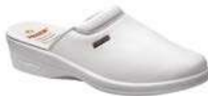
REF. 16014385 | TALLAS: 36-41 Zueco Blanco Mod. 465 PU