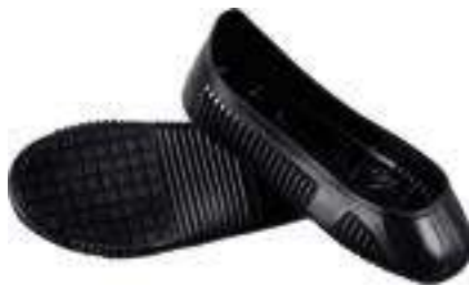
REF. 16020203 | TALLAS: S-M-L-XL Cubrecazado Antideslizante Easy-Grip