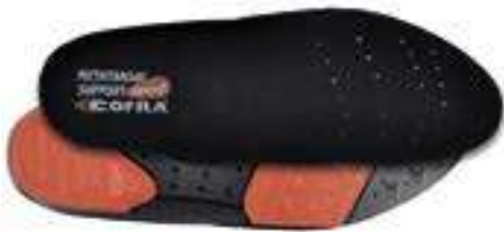
REF. 16014112 | TALLAS: 36-48 P. Plantilla Metatarsal Support Gel