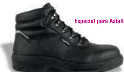
Especial para Asfalto

REF. 16014370 | TALLAS: 39-47 Bota Piel Serraje Hidrofugada DACHDECKER PU/Nitrilo O3