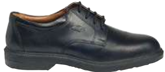
REF. 16001468 | TALLAS: 39-47 Zapato Piel Flor Hidrofugado EUCLIDE PU O2 FO SRC